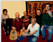
Ohrpiraten World- music

Die Ohrpiraten laden zu einer musikalischen Weltreise ein. Mit ihren Gitarren, Lauten, Flöten, Percu-